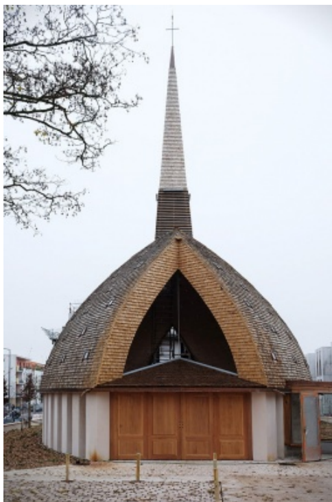
91009 duthilleul chapelle saint martin 01web

un oratoire ou une chapelle), ainsi que lieux pluriconfessionnels dans les espaces publics (aéroports, gares, hôpitaux...) Beaucoup de chapelles faisant partie intégrante d'églises sont en outre réaménagées pour la liturgie des heures, des temps autour de la Parole de Dieu ou d'oraison et ce, pour des assemblées plus petites. Aussi, face à la recrudescence de pratiques dévotionnelles, des réaménagements de chapelles ont lieu à l'occasion de la béatification de saints - et sont consacrées en leur honneur. Aujourd'hui, Jean-Marie Duthilleul est l'un des rares architectes à construire des édifices dans le souffle de Vatican 2.